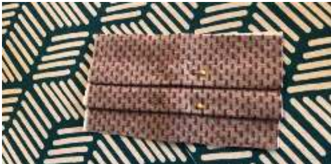
Planche los pliegues suavemente y fíjelos con dos alfileres. Ahora la pieza debería tener una altura aproximada de 10 cm, pequeñas desviaciones no significan ningún problema.

Luego doble a lo largo de las líneas punteadas del patrón. (Estas líneas son aproximativas y no es necesario seguirlas meticulosamente).